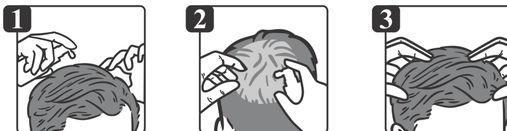
Figura C – Modo de uso:

4. Retire a tampa protetora da válvula para utilização do produto.