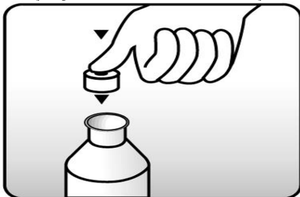
Fig. 1: coloque a tampa com orifício (batoque) no frasco.